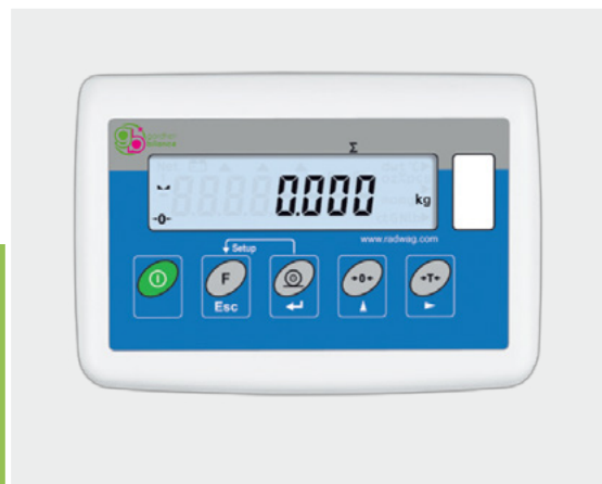
Indicatore con display LCD in ABS