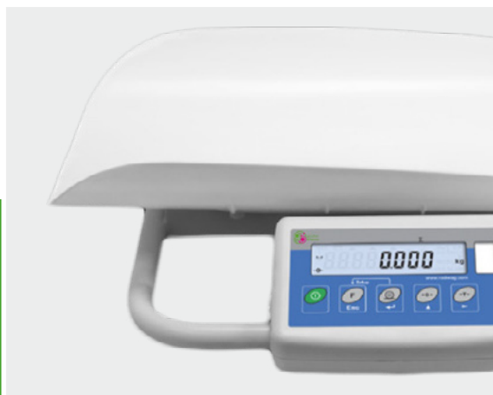
Piatto SYNTHOS PS HI 945E polistirene